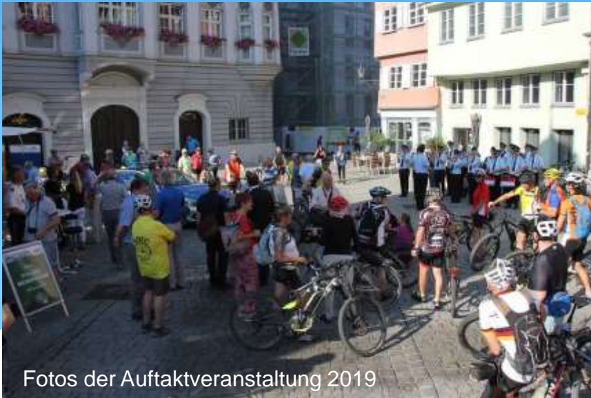
Fotos der Auftaktveranstaltung 2019