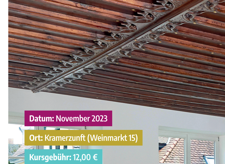
Decke der Kramerzunftstube

Datum: 10. Okt., 29. Nov. und 15. Jan. um 19:00 Uhr